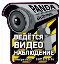
Стикер «Ведётся видеонаблюдение»