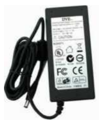
Блок питания регистратора