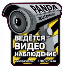
Стикер «Ведётся видеонаблюдение»